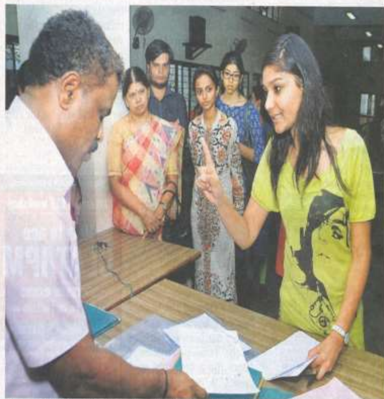
A worried lot: Several students flocked to the Karnataka Examinations Authority office in Bengaluru on Tuesday seeking clarification.

'Not factoring reservation for HK students led to re-allotment'