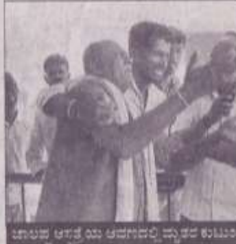
ಜಾಲಪ್ಪ ಆಸ್ಪತ್ರೆಯ ಆವರಣದಲ್ಲಿ ಮೃತರ ಕುಟುಂಬದವರು ಕೋವಿಡ್ ಸಾವನ್ನಪ್ಪಿದರು.