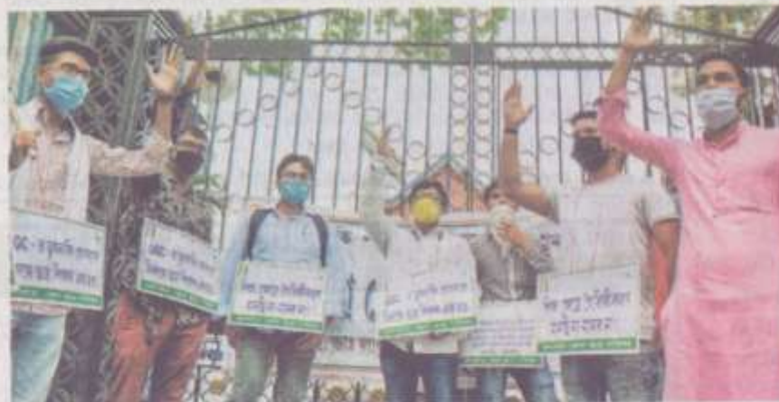
Raised voices: Members of the West Bengal State Chhatra Parishad staging a protest against the UGC in Kolkata earlier this month.

"Universities were approached to inform the status of the conduct of examination," the UGC said in a statement on Thursday. Out of 993 universities, 182 have informed the UGC that they have already conducted the examination, while another 272 plan to do so. Another 177 universities have in-