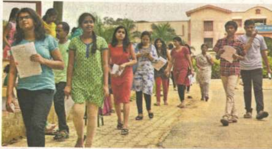
JUST DEMAND: The Medical Education Department has written to the Union Ministry of Health and Family Welfare requesting it to include Kannada in the list.